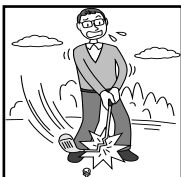
ゴルフクラブの破損・曲損