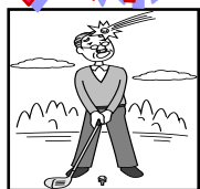
ゴルフ中の賠償事故